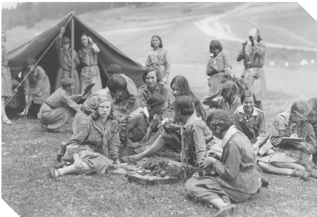
Biały Dunajec, 1930

Etap II: Uzupełnienie. Podchody nie tylko po polsku Obejrzyjcie poniższe fotografie.