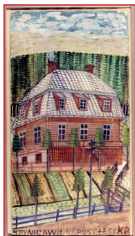
Nikifor, Pejzaż z architekturą ❧

Dzieła sztuki i rzemiosła obrazujące najważniejsze dziedziny polskiej kultury ludowej, o dużej wartości poznawczej, etnograficznej i historycznej, znajdują się w zbiorach muzeów etnograficznych, m.in. w zgromadzonej po wojnie kolekcji Państwowego Muzeum Etnograficznego w Warszawie (zbiory muzeum uległy całkowitemu zniszczeniu podczas II wojny światowej).