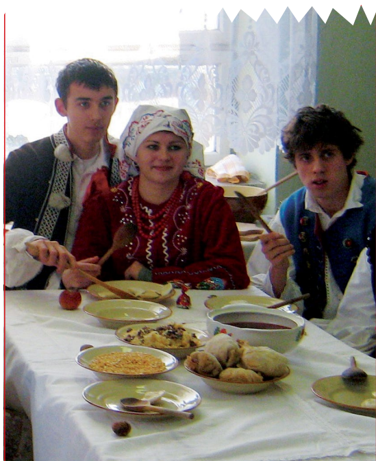
☞ Wigilia zorganizowana przez uczniów Zespołu Szkół nr 1 w Sanoku