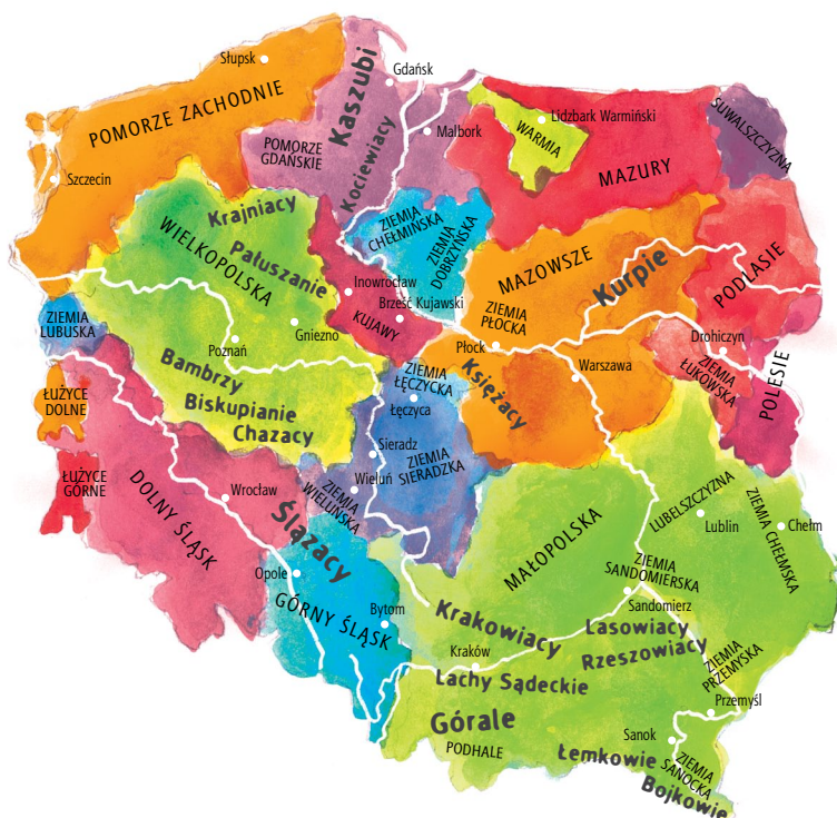
Mapa regionów etnograficznych Polski

To poczucie odrębności wiąże się bezpośrednio z pojęciem tożsamości kulturowej – czyli identyfikowaniem się grupy ludzi z określonymi zachowaniami, zwyczajami, miejscem, z którego pochodzimy, niezależnie od zmian w naszym życiu i np. przynależnością do wielu różnych grup. Wciąż dotyczy to większości z nas, choć zdaniem socjologów ostatnio