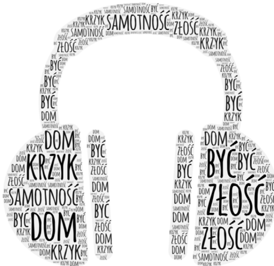
Przykład efektu pracy: Grafika pobrana z aplikacji

Poproś każdą osobę o wybranie 5 słów kluczy, które wydają jej się najważniejsze w napisanym przez siebie tekście. Mają być one sednem tekstu. Młodzież zapisuje je w formie chmury słów – za pomocą aplikacji: https://wordart.com/create lub samodzielnie tworząc takie wizualizacje w zeszytcie.