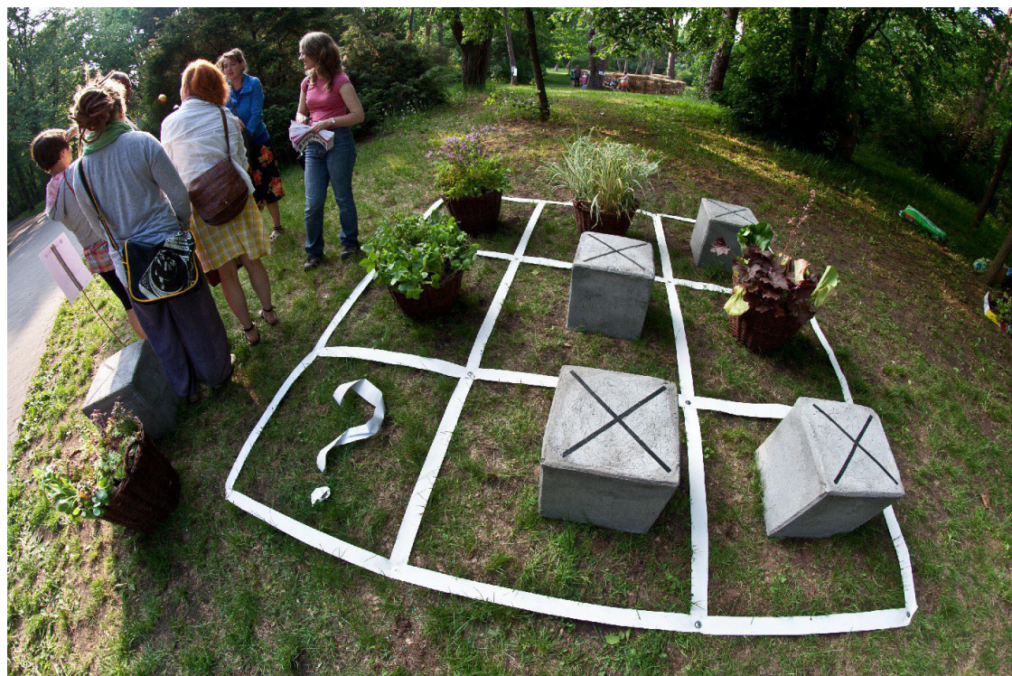
Zdjęcie 3. Gra logiczna Oleny Zapolskiej, Land Art Festiwal 2011.