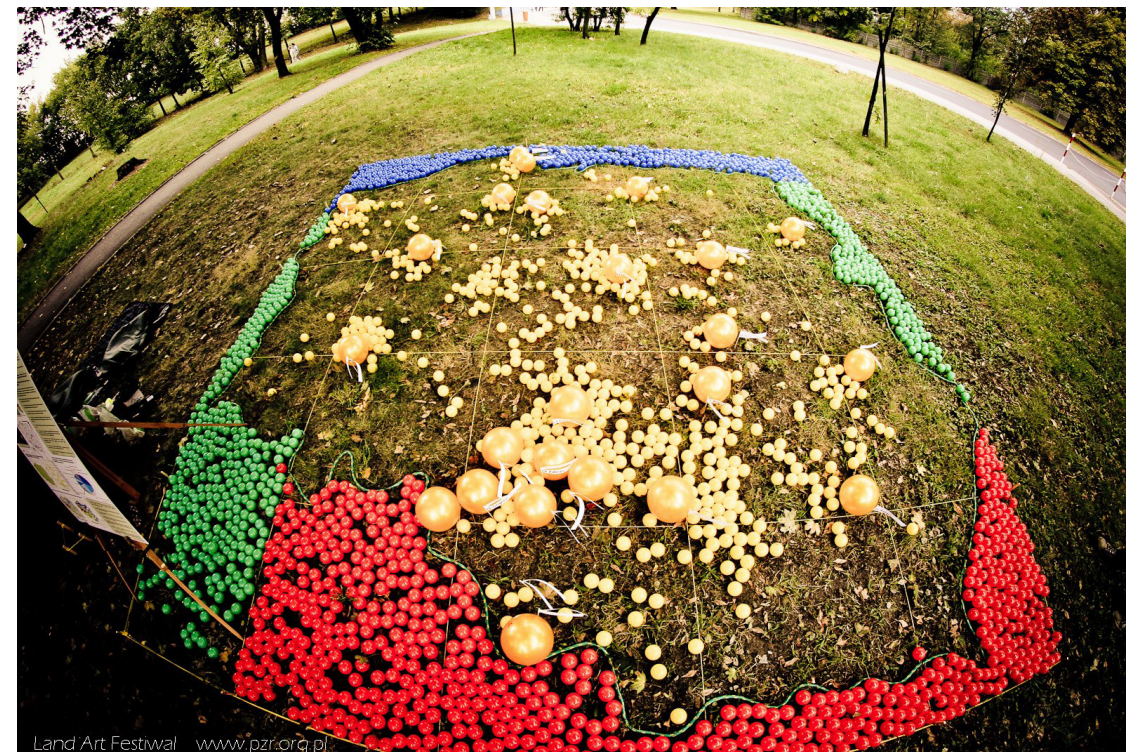
Zdjęcie 1. Instalacja „Pol-ball” witała widzów wchodzących od strony ronda na Placu Pokoju Toruńskiego. Dzieło składa się z niemal 2500 kolorowych piłek. W sposób obrazowy i zabawny przekazywało informacje o zużywanej przez nas energii.

Poniżej zamieszczono kilka przykładów instalacji, realizowanych podczas festiwalu Land Art oraz w ramach aktywności Domu Kultury „Bydgoskie Przedmieście” w Toruniu.